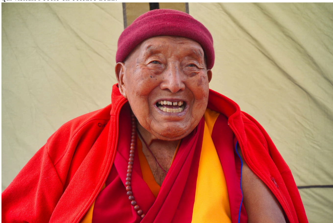
Le souhait de S.E. Yongdzin Tenzin Namdak Rinpoché pour les enfants est de leur offrir une éducation moderne combinée aux valeurs traditionnelles de leurs communautés.