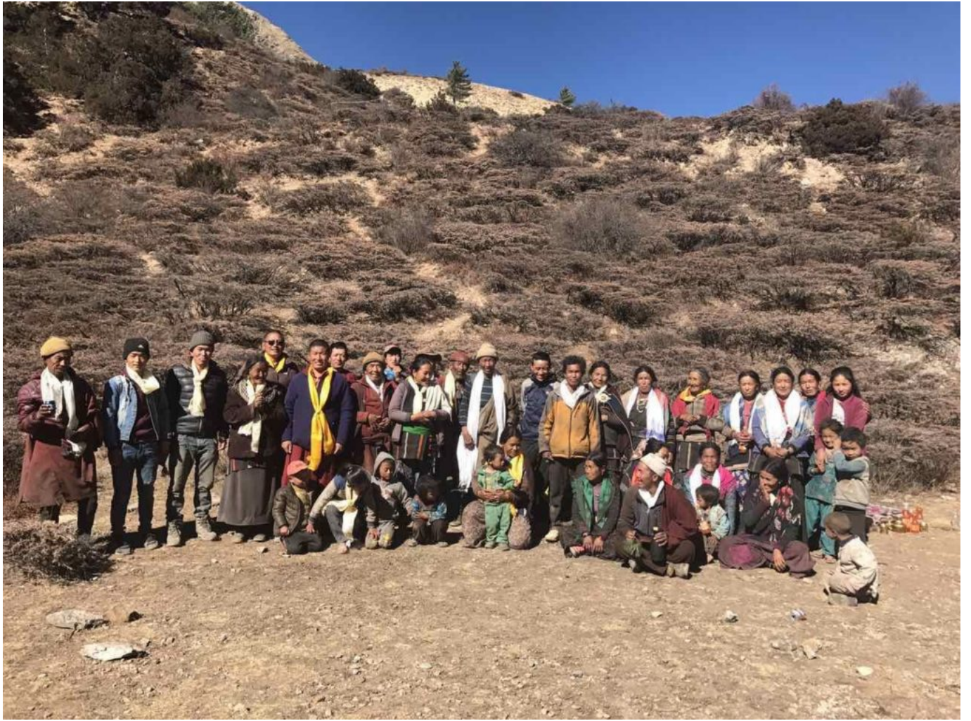
Life of the people of the Himalayas is hard.