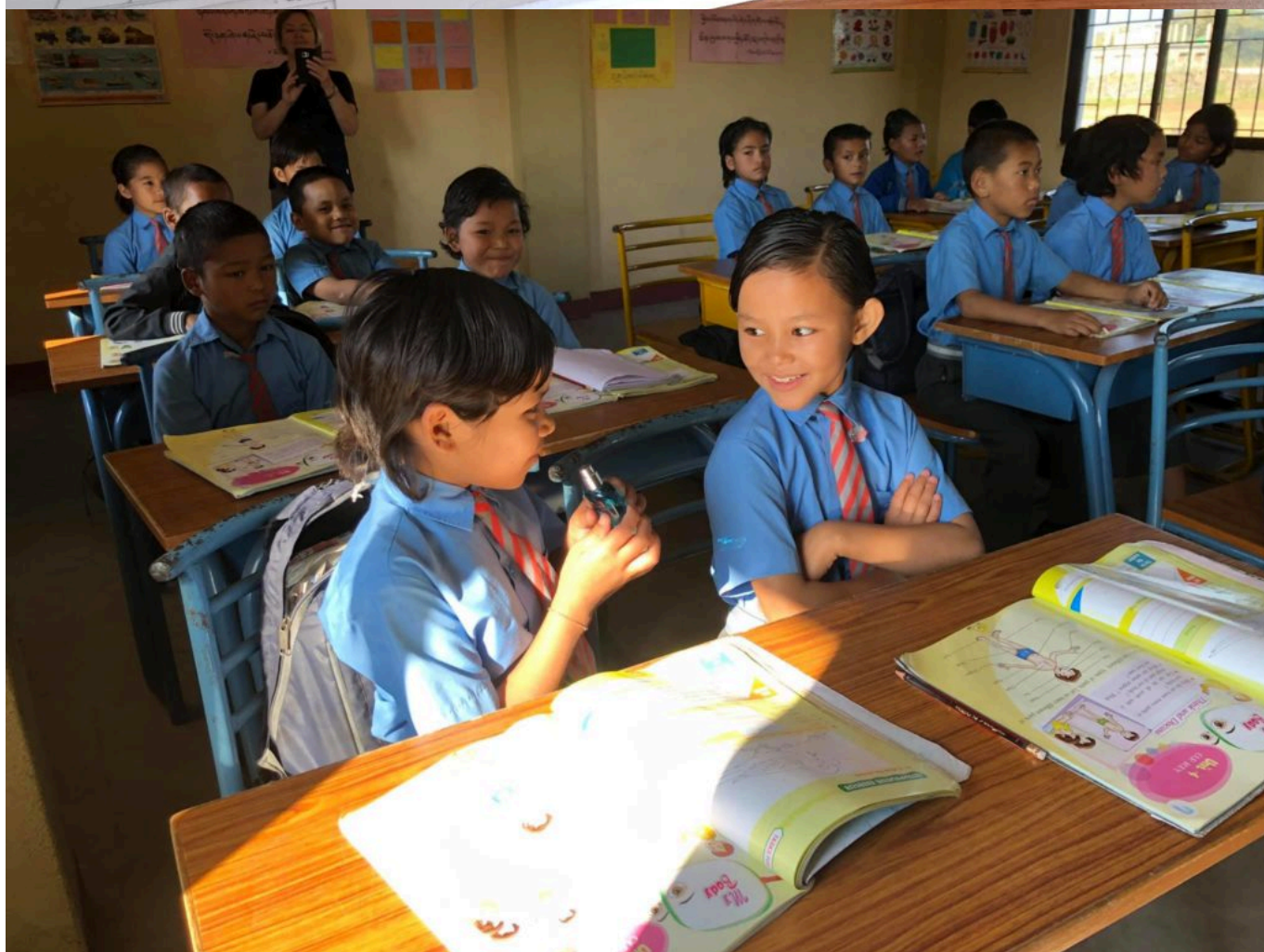
TL'école dispense un enseignement égal aux filles et aux garçons.