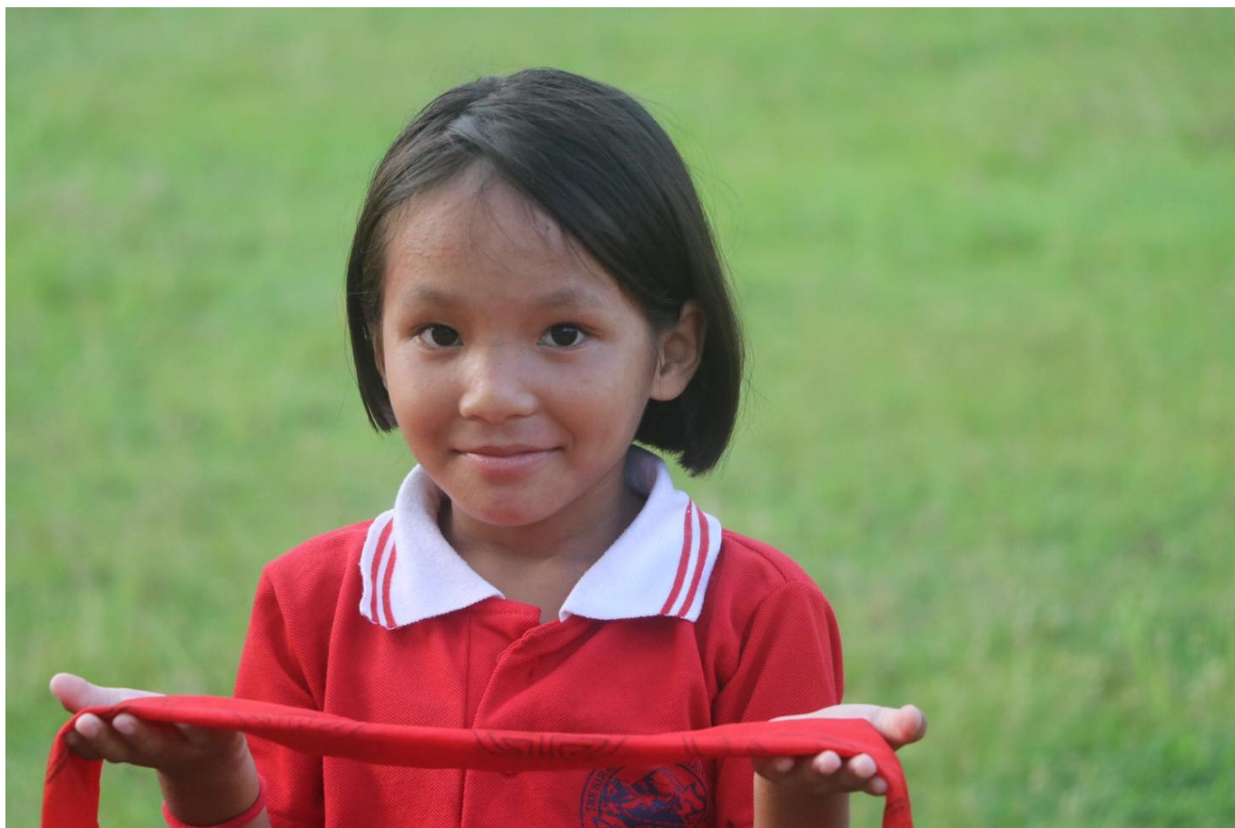
qui visitait l'école en octobre 2022.